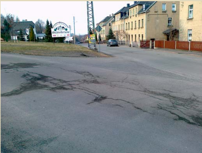
Alte Oelsnitzer Straße in Hohndorf