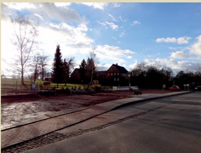
Lindeplatz vor der Montessori Grundschule Erlbach-Kirchberg