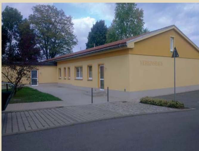
Sanierung der Heizungsanlage und Außenfassade