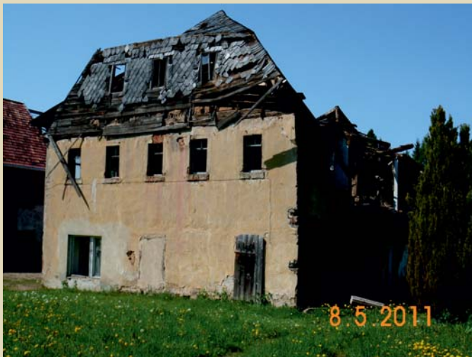
Ungenutztes Wohngebäude in Erlbach