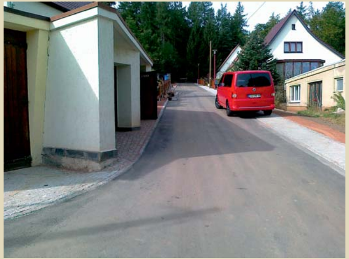
Sanierung der Straße