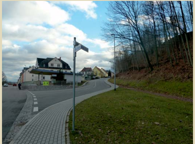
Straßenausbau und Sanierung