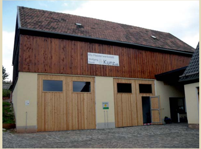
Umnutzung zur Autowerkstatt