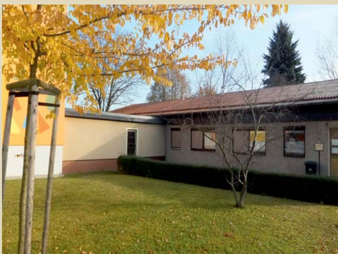
Kita „Rappelkiste“ mit Vereinshaus in Hohndorf