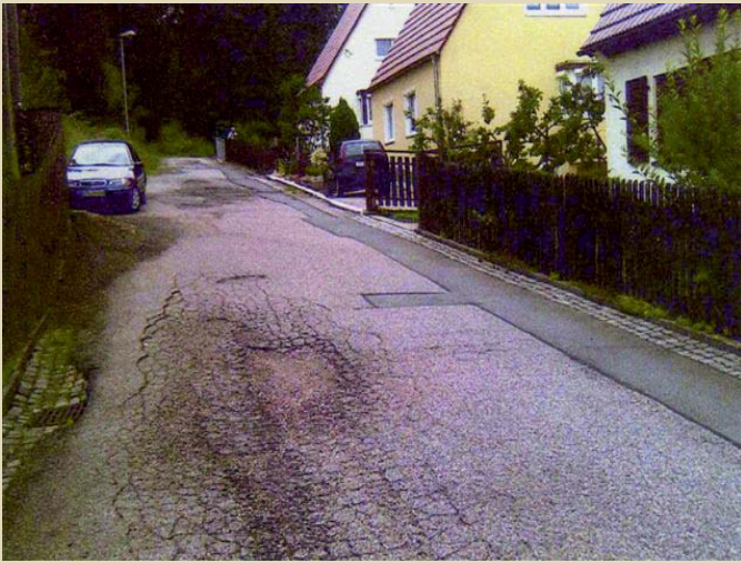
Forstweg in Hohndorf