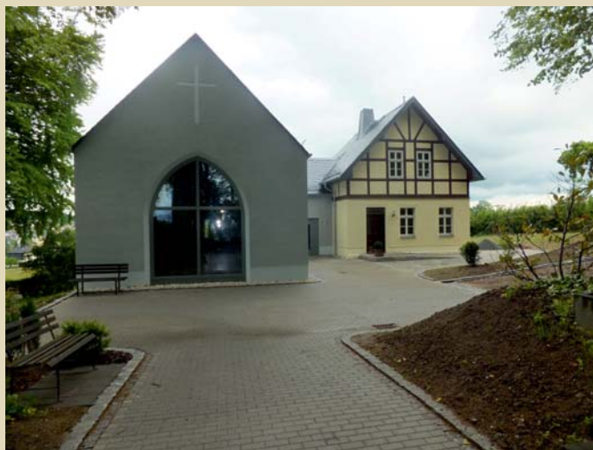
Sanierung der Friedhofshalle