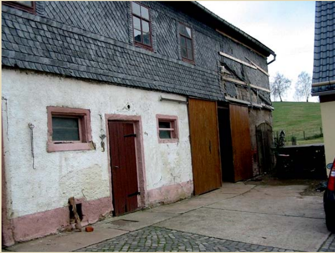
Ungenutzte Scheune in Erlbach-Kirchberg