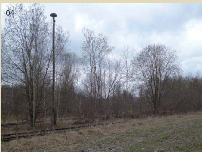
Stillgelegte Gleisanlage im Bürger- und Familienpark Oelsnitz