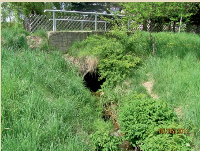
Entwässerungsgraben an der Neuen Straße in Neuwürschnitz