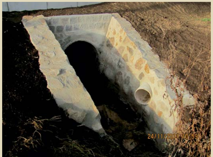
Sanierung des Entwässerungsgrabens