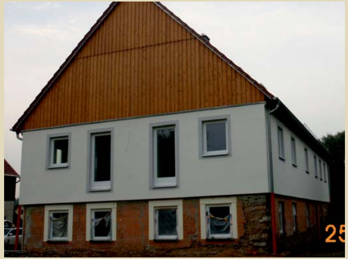
Wiedernutzung als Wohngebäude