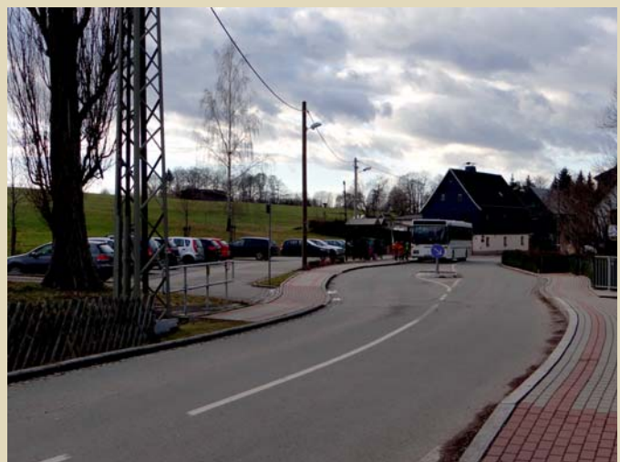
Neubau Parkplätze und Bushaltestelle