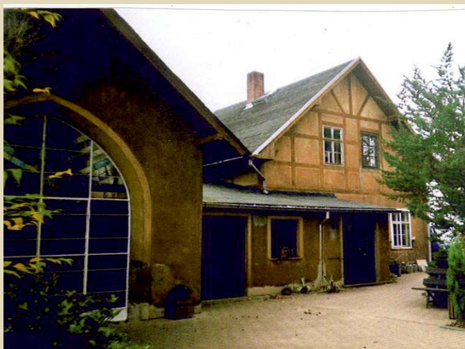
Friedhofshalle in Hohndorf